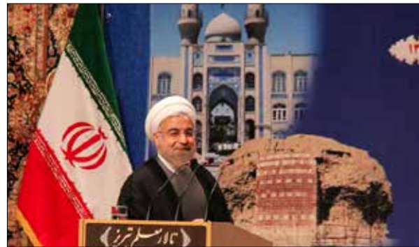
دیدار رئیس جمهور با علما، ایثارگران و برگزیدگان آذربایجان شرقی