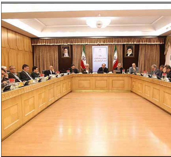
فرصت‌های سرمایه گذاری استان آذربایجان شرقی از سوی مسئولان استان و مدیران دستگاه‌ها و سازمان‌های توسعه ای و بانک‌ها ارائه شد.

جلسه‌ی توسعه سرمایه‌گذاری استان آذربایجان شرقی به ریاست محمد شریعتمداری معاون اجرایی رییس جمهور و با حضور محمدرضا نعمت زاده وزیر صنعت، معدن و تجارت، استاندار آذربایجان شرقی و جمع زیادی از مسئولان و مدیران دستگاه‌ها و سازمان‌های توسعه‌ای و بانک‌های استان برگزار شد.