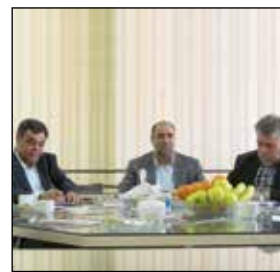
میزگردی با حضور نماینده دولت، نماینده بخش خصوصی و دبیر اجرائی تشکیلات خانه کارگر تبریز