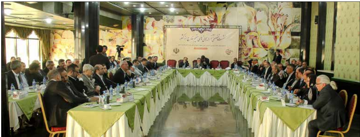
نشست آذربایجانی های مقیم خارج از کشور در تبریز