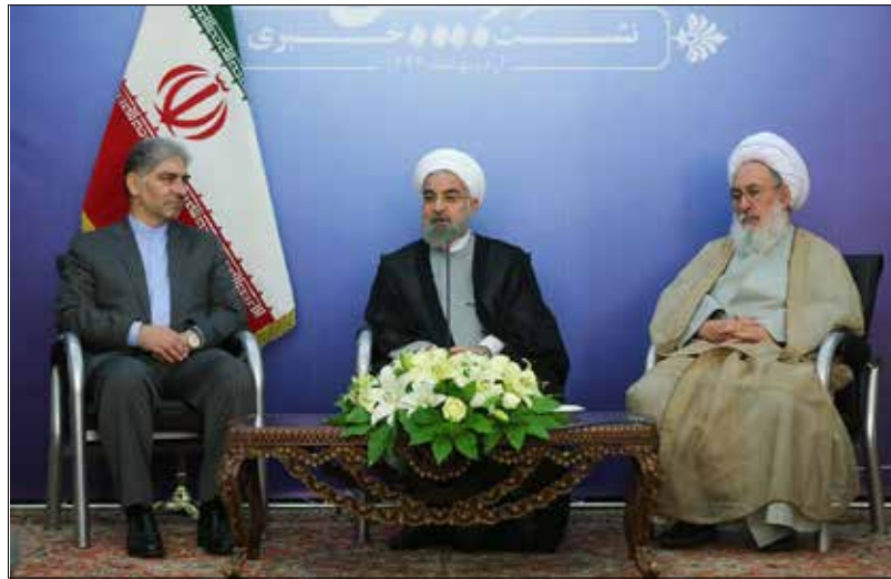
نشست مطبوعاتی رئیس جمهور در تبریز