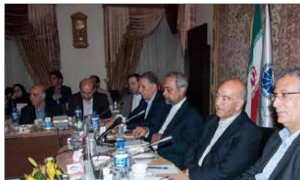
نشست «نهادمدیان» با فعالان اقتصادی آذربایجان شرقی