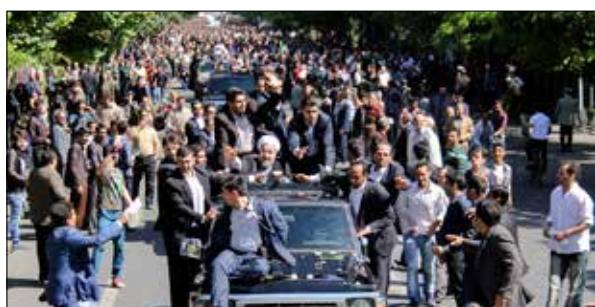
استقبال مردم از رئیس جمهور در تبریز