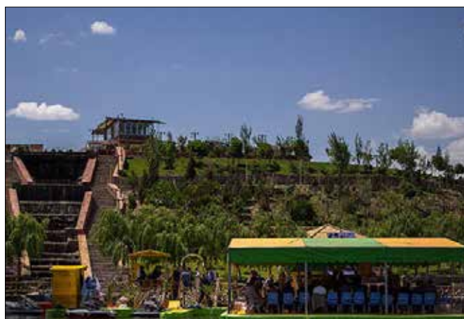
بازدید معاون رئیس جمهور از دهکده توریستی سد اماند