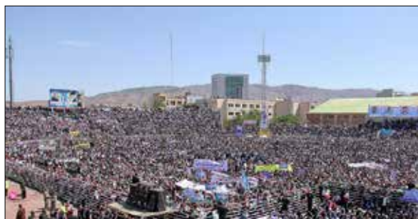
سخنرانی رئیس جمهور در استادیوم تختی تبریز