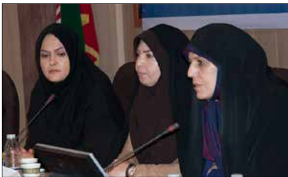
برگزاری کارگروه تخصصی امور بانوان آذربایجان شرقی با حضور معاون رئیس جمهور در تبریز