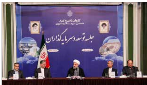
دیدار رئیس جمهور روحانی با فعالان اقتصادی آذربایجان شرقی