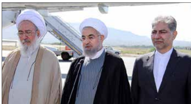
استقبال رسمی مقامات آذربایجان شرقی از رئیس جمهور در فرودگاه بین المللی شهید مدنی تبریز