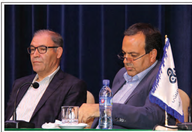
▲ حضور مقامات و مدیران بخش دولتی و خصوصی در دومین همایش معرفی برترین شرکت های منطقه آذربایجان